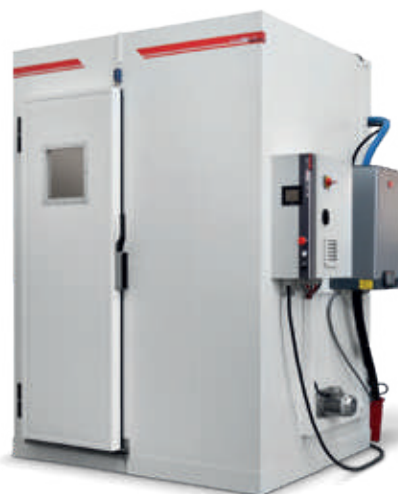
Customized Climatic Chambers