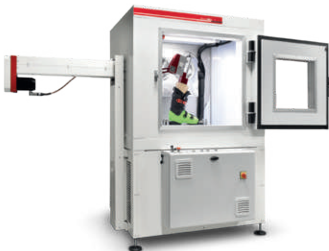
Special System for boot testing