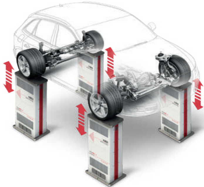
Damper Test System HUD20 with 4 synchronized machines